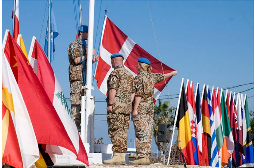
Overdragelsesparade d. 1. december 2009.

Under protektion af Hans Kongelige Højhed Prinsgemalen og Associeret medlem af Museum Sønderjylland.