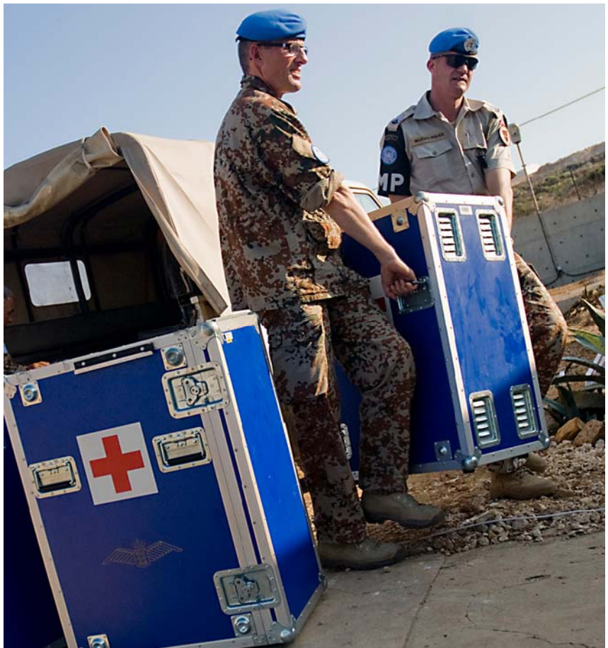
Lægens ”Blå klinik” slæbes på plads