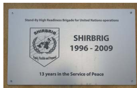
Mindeplade om SHIRBRIG, som er opsat på bygning 3 på Høvelte kaserne.

På et område fortsættes SHIRBRIGs indsats i forstærket form. De nordiske lande har overtaget arbejdet med at støtte de østafrikanske lande i deres opbygning af en fredsstøttende kapacitet. Norge, Sverige, Finland og Danmark har netop fællesskab netop oprettet NACS (Nordic Advisory and Coordination Staff) med hovedkvarter i Nairobi, Kenya, og herfra vil de udsendte nordiske officerer koordinere vores fælles indsats i Østafrika.