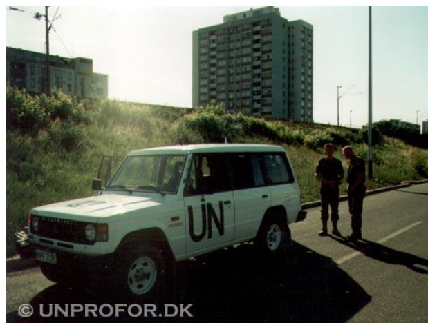
Pajeroen parkeret i Karlovac

Efter noget tid gav vores danske seniorsergent efter for presset og måtte simpelthen lægge sig ned på vejen. Ikke et ondt ord om dette - vi havde alle mest lyst til at gøre det samme. Vi fik hende hjulpen ind i bilen og tog bagefter - modstræbende - opstilling ved bilerne igen.