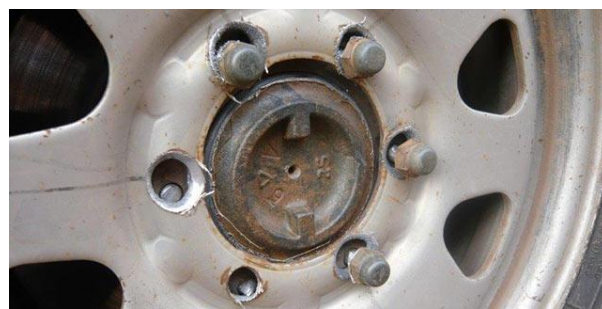
Denne bil kørte 200 kilometer i den tilstand.

Bilen på nedenstående billede, en Nissan, blev kørt på værksted, fordi føreren syntes, den var ”underlig” at køre i. Vedkommende havde kørt 200 kilometer i bilen uden at opdage noget, da en passager gjorde opmærksom på fejlen.