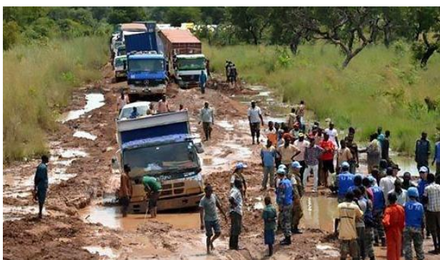
Dette billede er på ingen måde unikt, men giver et ganske godt indtryk af forholdene under regntiden.

De mest udpinte biler er allerede afskrevet, og Transportsektionen regner med, at mere end 400 biler ryger samme vej, fordi vedligeholdelsesudgifterne er for høje, og fordi der ikke er hårdt brug for så stor en bilpark. Missionen tildeles desuden 150 nye biler, så den ikke kun råder over slidte, ældre biler.