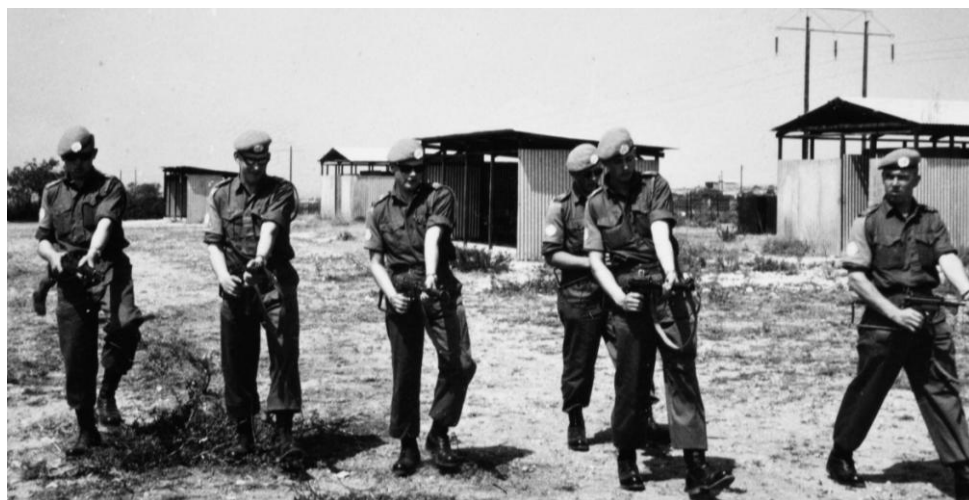
Danske soldater træner rydning af menneskemængde i den britiske militærlejr Dhekelia.

FN Museet vil have særlig fokus på Cypern i hele 2014 og håber at kunne lave nogle særlige arrangementer med de 30 års indsats på Cypern i centrum.