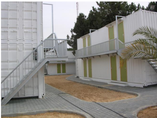
De færdige bygninger

Man lovede at bygningerne var færdige til opstart inden for 8 dage.