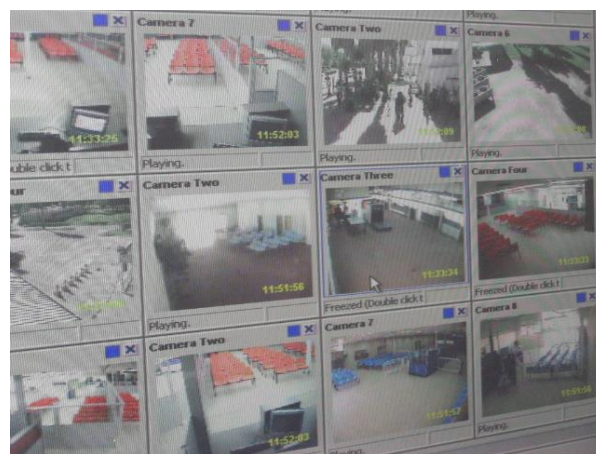
Skærme med video overvågning

data på folk der krydsede grænsen. I kommandorummet skulle der være plads til den palæstinensiske, israelske og EU's operative chefer.