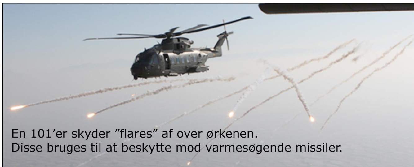
En 101'er skyder ”flares” af over ørkenen. Disse bruges til at beskytte mod varmesøgende missiler.

Der blev indkøbt 14 helikoptere til levering i 2006 og 2007. Af de 14 101'ere skulle en pulje anvendes specifikt som TTT-helikoptere. Undervejs blev det aftalt, at seks af de danske 101'ere skulle overdrages til Storbritannien, da der her var akut mangel på dem. Som erstatning fik Danmark seks nye leveret i 2009 og 2010.