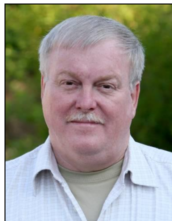
FN Museets formand

Alle de parametre vi normalt måler os på så som besøgende, omsætning, støttemedlemmer og overskud har alle sat rekord, nogle af dem er enddøgt tredoblet!