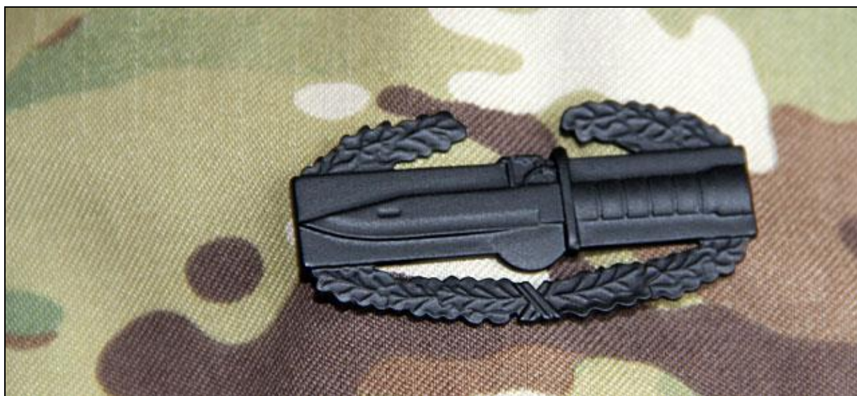
Combat Action Badge

trækker i samme retning som os. Men det er de få, som gør det vanskeligt for os at operere og støtte det afghanske folk, og derfor vi bruger rigtig mange ressourcer på egen beskyttelse, når vi er ude. Det er det som er forskellen på os og mange andre velmenende organisationer, siger Thorsten.