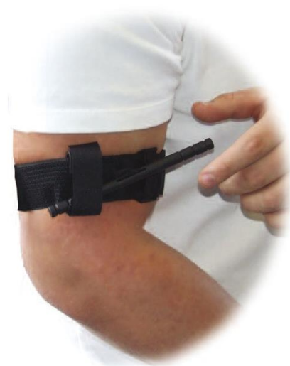
Tourniquet et moderne knebelpress, der kan anlægges med en hånd.

Han har været heldig. Indgangshullet i siden ligner en lille Mercedes-stjerne. Ved siden af ham sidder afghansk general, som er ramt gennem skinnebenet. Han bløder kraftigt og er helt askegrå i hovedet. Jeg må skaffe nogle forbindinger og et tourniquet (knebelpress).